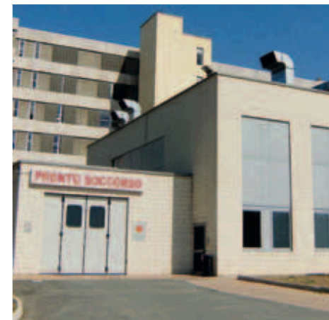
La sanità acquese è sempre in fibrillazione